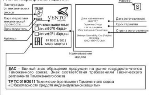
Рис. 2. Маркировка изделия