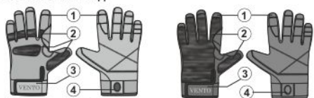
Рис. 1. Внешний вид

Перед использованием данного СИЗ Вы обязаны: - Прочитать и понять инструкцию по эксплуатации. - Познакомиться с потенциальными возможностями и ограничениями по его применению. - Осознать и принять вероятность возникновения рисков, связанных с применением СИЗ. Игнорирование этих предупреждений может привести к травмам.